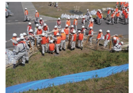
水防工法訓練の様子

そのほかにも、私は分団の詰所へ行って、団員へ工法の手順や安全教育を行ったり、小学校や地域での防災教育を行ったりしています。