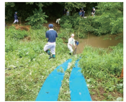
排水ポンプを河川内に設置している様子(平成30年7月豪雨)