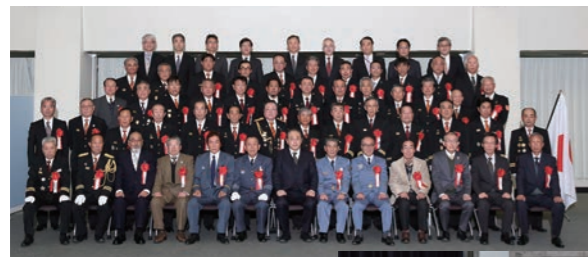
令和元年度水防功労者 国土交通大臣表彰受賞者

水防管理者の所轄の下に水防に従事し、当該水防に著しい功績のあった個人又は団体を表彰する制度で、昭和26年より実施しています。