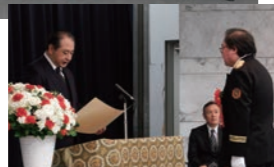
表彰状授与の様子