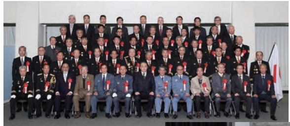
令和元年度水防功労者 国土交通大臣表彰受賞者

水防管理者の所轄の下に水防に従事し、当該水防に著しい功績のあった個人又は団体を表彰する制度で、昭和26年より実施しています。