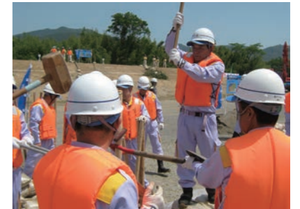
岐阜市水防連合演習の様子

また、訓練のほかに、水門の点検や地域行事へも参加します。水門の点検では、稼働確認はもちろん、ゴミ拾いや草刈りもします。地域行事では、水防工法を実演したり、地域の方に土のうの作り方を教えたりもしているんですよ。