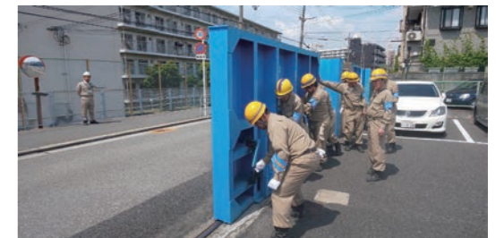
此花区で行われた鉄扉閉鎖訓練の様子

工法訓練や無線訓練、鉄扉閉鎖訓練などを行い、いざという時に備えています。工法訓練では、地域ごとに協力して工法を行い、無線訓練では、いざという時に正しく情報を伝えられるように無線機の操作方法などの確認を行っています。鉄扉閉鎖訓練というのは、淀川や大阪市内の河川、港湾地区で洪水や高潮などが発生した時に被害がでないよう設置してある防潮鉄扉を閉鎖する訓練です。