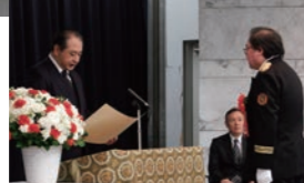
表彰状授与の様子